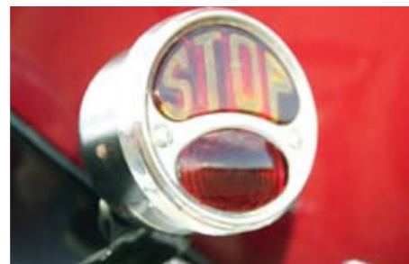
Tähelepanu detailidel: piduritule saanuks ju valmistada lihtsamalt, kuid see poleks stiilne.