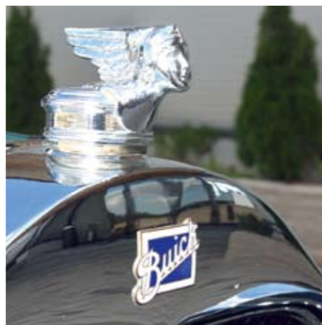
Vana sõiduki puhul väärib iga pisidetali eraldi imetlemist.