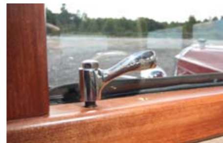
Ukse avamiseks tuleb pöörata hoovakest, mille kujustus on vaatamisväärsus omaette.

Kui palju kulub Sul ühes kuus kütusele? Nüüd lahuta sellest 45%.