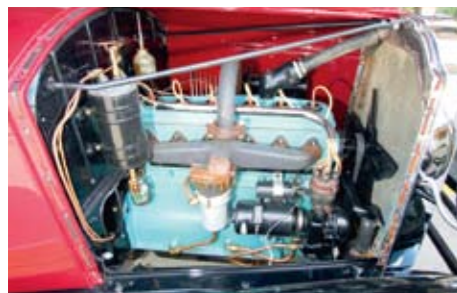
Willyse mootor on erakordselt vaikse käiguga, sest klappe asendavad liikuvad silindrihülsid.