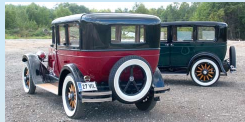
Willys-Knight (vasakul) ja Buick Model 27 kuuluvad LaitseRallyParki autokollektsiooni.

Tegemist on vägagi omapärase jõuallikaga, sel puuduvad traditsioonilised klapid, nende rolli täidavad hoopis liikuvad silindrihülssid, kaks iga silindri kohta. Kolbi liigutab kepsu vahendusel väntvõll nagu ikka, hülssse (sise- ja välimine) aga eraldi võll, mis pöörleb väntvõllist poole aeglasemalt. Hülssid avavad-sulgevad oma liikumisega sisse- ja väljalaske-