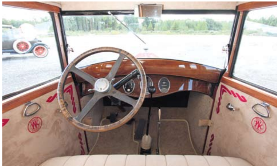
Puitdetailid ning tikanditega kaunistatud polsterdus teevad Willyse sõitjateruumist salongi.

Juhtavuselt osutub Buick vaat et Willyse vastandiks. Tänapäevastel sama klassi autodel nii suurt erinevust kindlasti ei kohta. Buicki reageerib juhi igale liigutusele innukalt, Willysega võrreldes isegi liigselt, rööpas asfaltteel otsib teed ja nõuab juhil täit tähelepanu - ei mingit „jalga üle põlve“ laisklemist