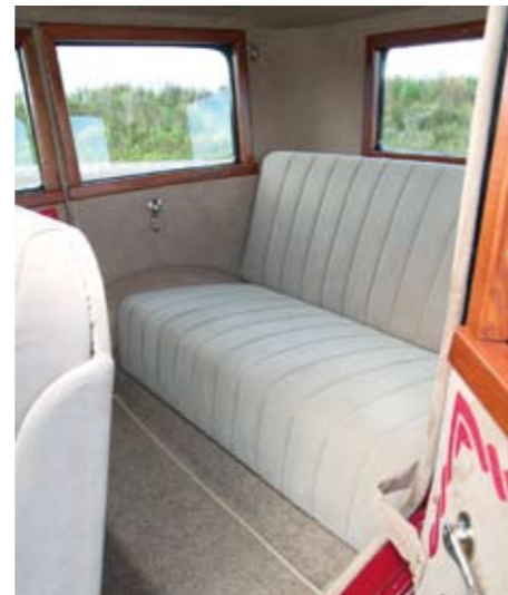
Willyse tagaiste meenutab diivanit, istuda on seal mõistagi väga mõnus.