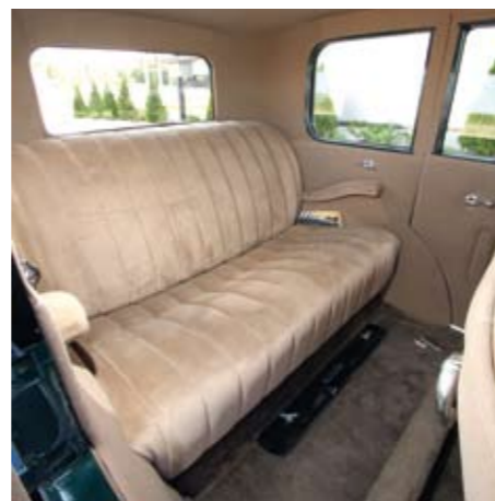
Buicki tagaistmel on erakordselt mugav: palju jalaruumi, käetoed, pehme padi ja seljatugi.