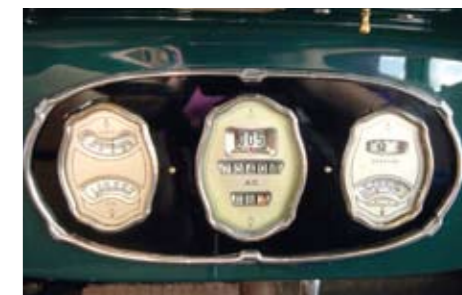
Näidikuploki keskel on spido-, vasakul amper- ja mano-, paremal termomeeter ja kütusenäidik.