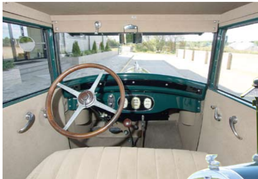
Buicki metallist armatuurlaud mõjub moodsamalt kui Willyse puidust analoog.

Autoleht tänab LaitseRallyParki autode laenamise eest.