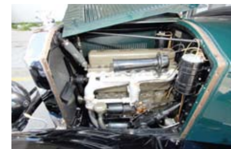
Buicki mootor arendab 64 hobujõudu. Mootori hääl sarnaneb natuke GAZ-51 kõlaga.